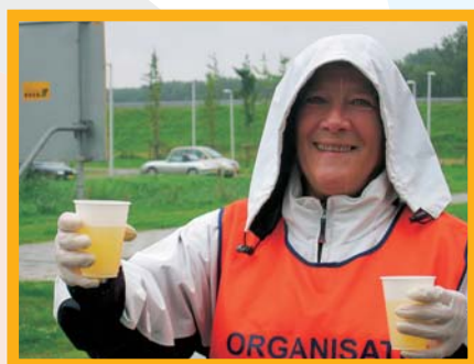
"Lopen door weer en wind belonen we met zorg door weer en wind"