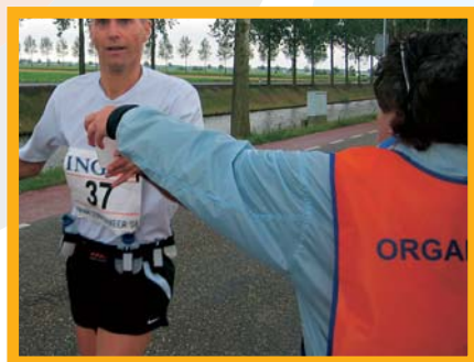
"Water buiten, maar ook van binnen"