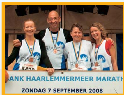
"RWE sponsorde het Bardo-team, dat 5 km ver genoeg vond"

Hospice Bardo is zeer de moeite waard om gesteund te worden. Word daarom lid van de Vriendenclub van Hospice Bardo of stort een donatie op rekening 32.45.72.093 bij de Rabobank.