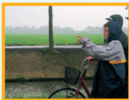
"Hij is die kant op, had blijkbaar haast"