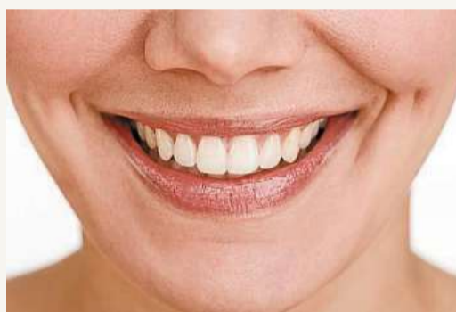
Witte tanden willen we allemaal.